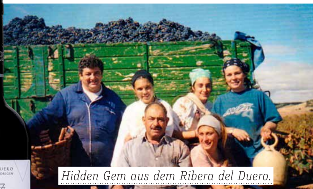
Hidden Gem aus dem Ribera del Duero.