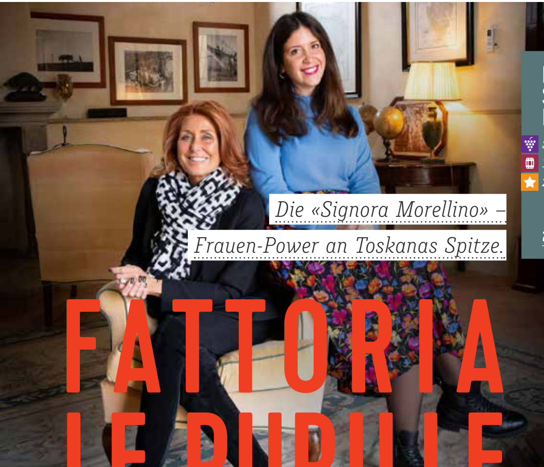
Die «Signora Morellino» – Frauen-Power an Toskanas Spitze.